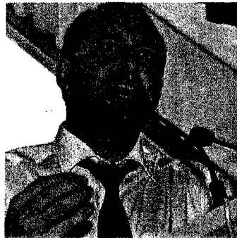
Hubert Aiwanger redet dem Volk nach dem Mund.