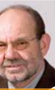
Glas (54) Ingenieur (FH), Messungsingenieur, g