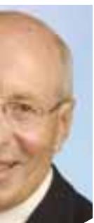
Hiedermeier (63) Berater, ster,